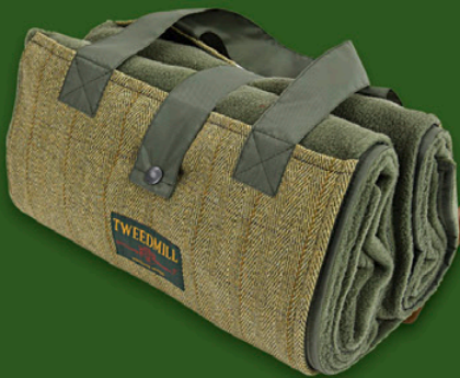
Tweeddecken in verschiedenen Tartans und Größen