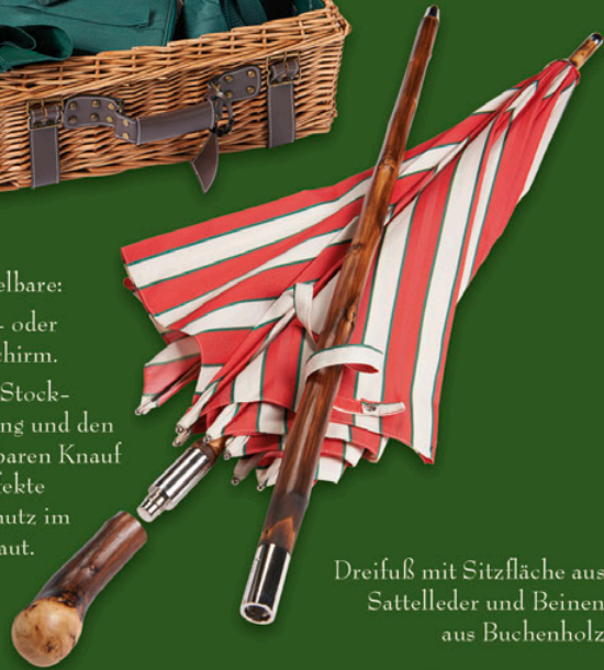
Dreifuß mit Sitzfläche aus Sattelleder und Beinen aus Buchenholz

Durch die Stockverlängerung und den abschraubbaren Knauf ist der perfekte Sonnenschutz im Nu aufgebaut.